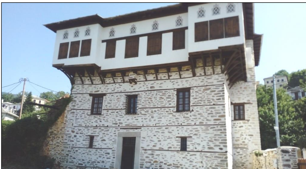
Αρχοντικό Οικογένειας Γκλαβάνη